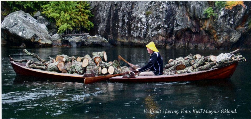
Vedfrakt i fjæring.

Oselvaren er en tradisjonell, klinkbygd båttype fra Hordaland. Denne båttypen er tradisjonelt blitt benyttet som bruksbåt, til kapproing og kappseiling. Navnet Oselvar dukket opp på 1750-tallet, men båttypen er eldre enn det. Den smekre trebåten bygges fortsatt på Os, og det er nettopp Oselvarverkstaden og miljøet rundt som nå er innlemmet UNESCOs register over gode vernepraksiser