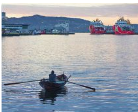
BYMANN OG STRIL: Oselvaren er brukt både av bymann og stil. Fra distriktet kom de roende inn til Bergen med fisk. Men det var også mange byfolk som etter hvert brukte dem til seiling og roing.