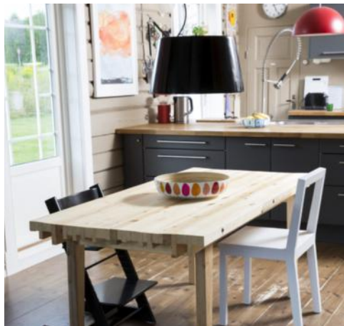
Bordplata er laga av 31 plankar Eivind Platou hadde til overs. Legg merke til bordenden..